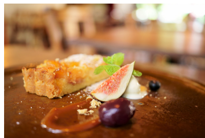
Distancia focal: 35mm | Exposición: F/2.8 1/25 s ISO 800

Las distancias mínimas de enfoque de los objetivos de 20mm, 24mm y 35mm son 0,11 m, 0,12 m y 0,15 m respectivamente. De ello resulta la mayor relación de ampliación posible de 1:2 para los tres objetivos. Incluso los objetos pequeños se pueden fotografiar de forma que ocupen la imagen completa. El usuario no se volverá a frustrar por no poder acercarse lo suficiente a un objeto. Gracias a estas características puede componer imágenes con una perspectiva extremadamente dramática (los objetos fotografiados de cerca parecen más grandes, los que están más lejos más pequeños). El objetivo de distancia focal fija de F/2.8 también permite fotografías únicas con un atractivo desenfoque de fondo.