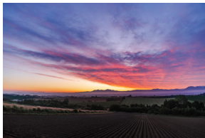
Distancia focal: 20mm | Exposición: F/2.8 1/40 s ISO 100