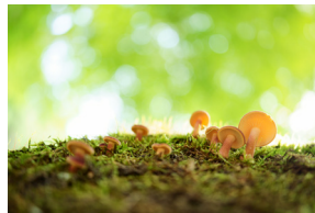
Distancia focal: 35mm Exposición: F/2.8 1/50 s ISO 500

Tamron amplía su gama con tres distancias focales fijas para las cámaras Sony E-Mount con sensor de fotograma completo. Además de una alta luminosidad de F/2.8, ofrecen una reducida distancia de enfoque (relación de ampliación 1:2) y son extraordinariamente compactos. El ultra gran angular 20mm F/2.8 Di III OSD M1:2 (modelo F050) permite composiciones de imagen completamente nuevas. El súper gran angular 24mm F/2.8 Di III OSD M1:2 (modelo F051) literalmente amplía el horizonte. Y el gran angular estándar 35mm F/2.8 Di III OSD M1:2 (modelo F053) es ideal para la fotografía generalista. Gracias a la corta distancia mínima de enfoque se pueden crear escenas con perspectivas muy dinámicas y con los motivos más diversos, ya sean el paisaje, la naturaleza o las instantáneas familiares. Las distancias focales fijas se caracterizan por su poco peso y sus prácticas dimensiones. Incluso si lleva los tres consigo, viajar completamente cómodo. Los cristales ópticos especiales, incluidos los elementos de baja dispersión (LD) y asféricos modelados en vidrio (GM), suprimen las distorsiones de las imágenes. El legendario revestimiento BBAR (Broad-Band Anti-Reflection) de Tamron minimiza la luz parásita y los brillos. Además, las correcciones de imagen en la cámara* se pueden utilizar para aprovechar todo el potencial de los sensores de imagen de alta resolución. ¡Estas distancias focales fijas abren expresiones creativas completamente nuevas para usted!