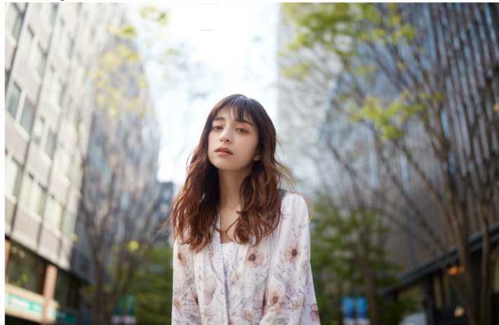
Distancia focal: 35mm; Exposición: 1/800 seg., F/1.4, ISO 100

El mejor objetivo TAMRON de todos los tiempos